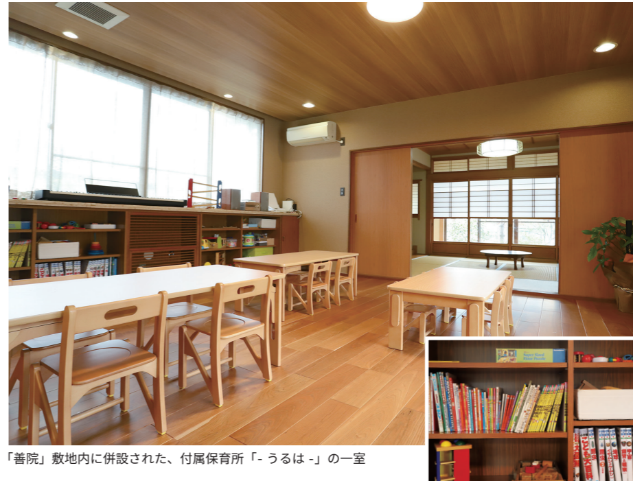
「善院」敷地内に併設された、付属保育所「-うは-」の一室